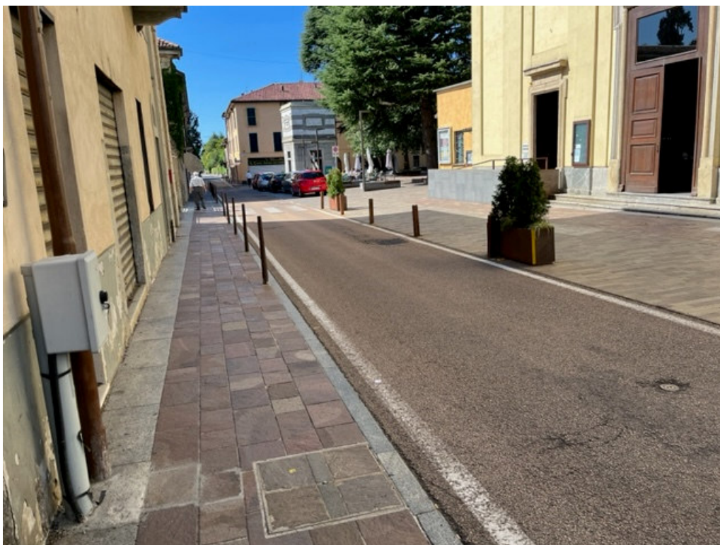
Foto n. 5 – Piazza Vittorio Emanuele II in corrispondenza della Chiesa