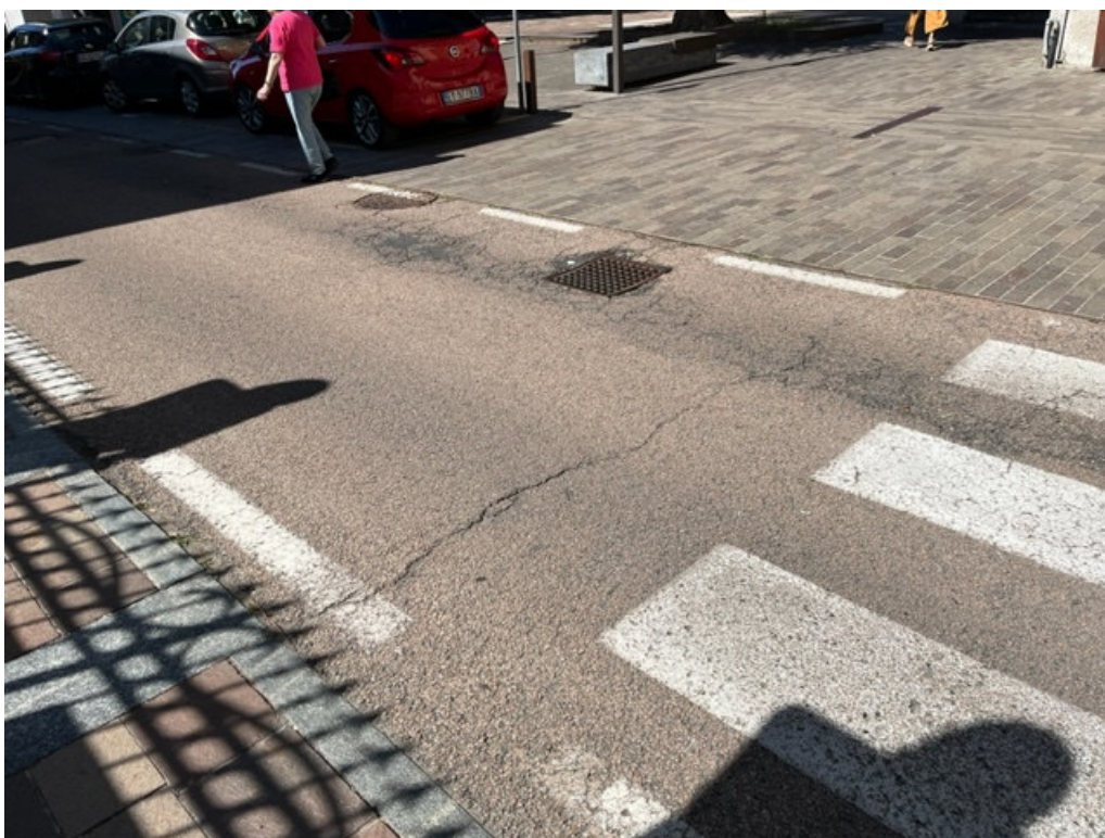
Foto n. 6- Particolare Piazza V.E. II