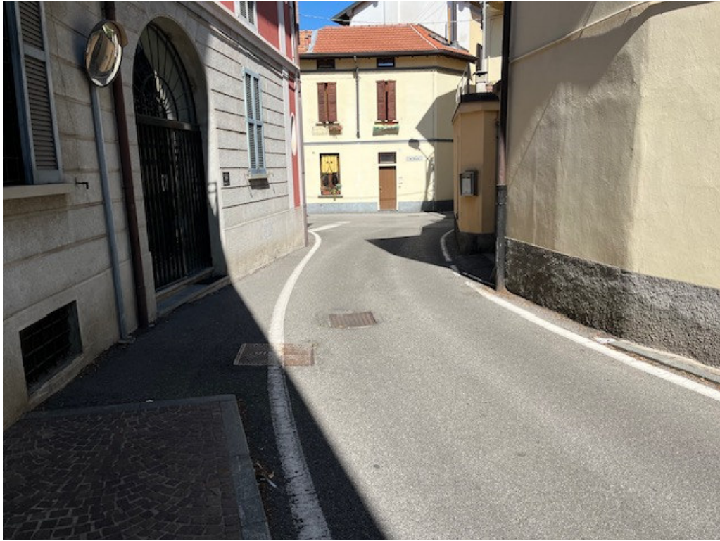
Foto n.11- Via Cavour