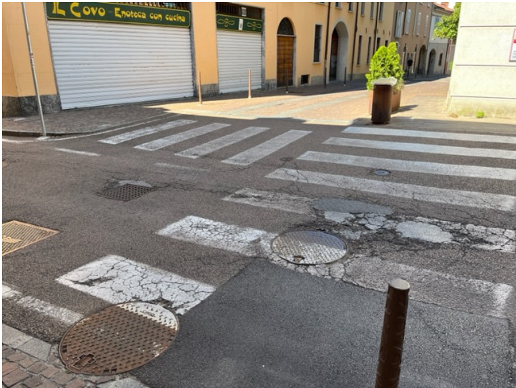
Foto n. 7- Particolari ioncrocio con Via Cavour