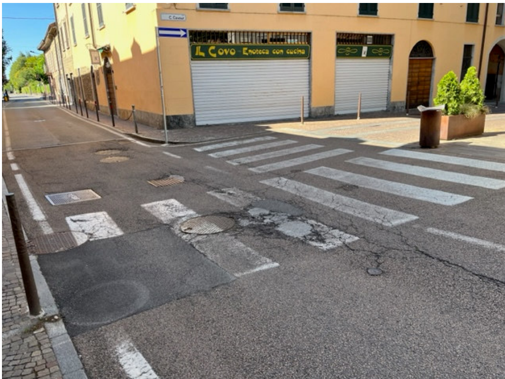
Foto n. 8- Particolari incrocio con Via Cavour