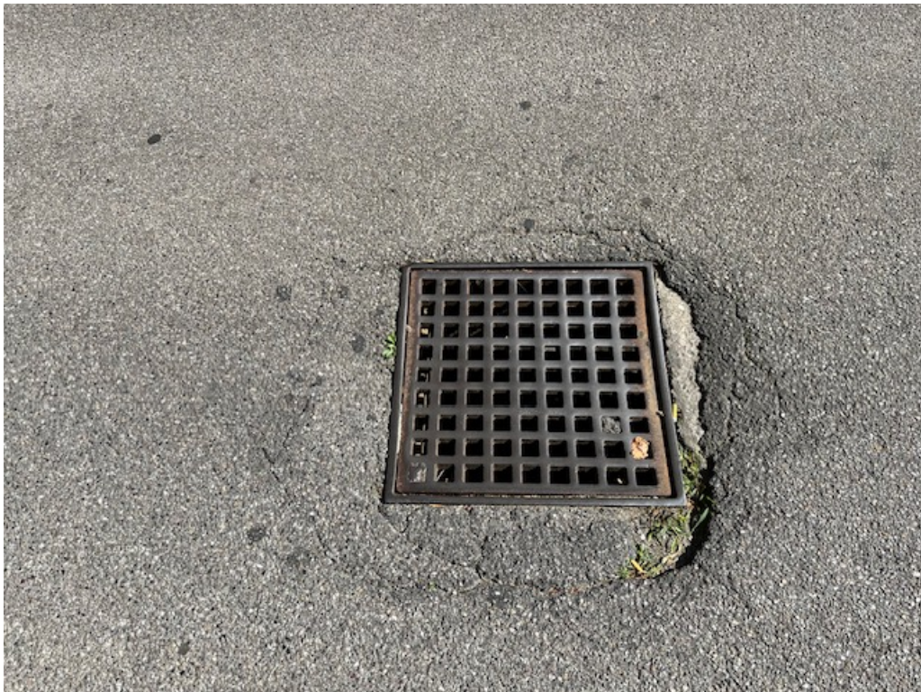
Foto n.12- Particolare caditoia Via Cavour