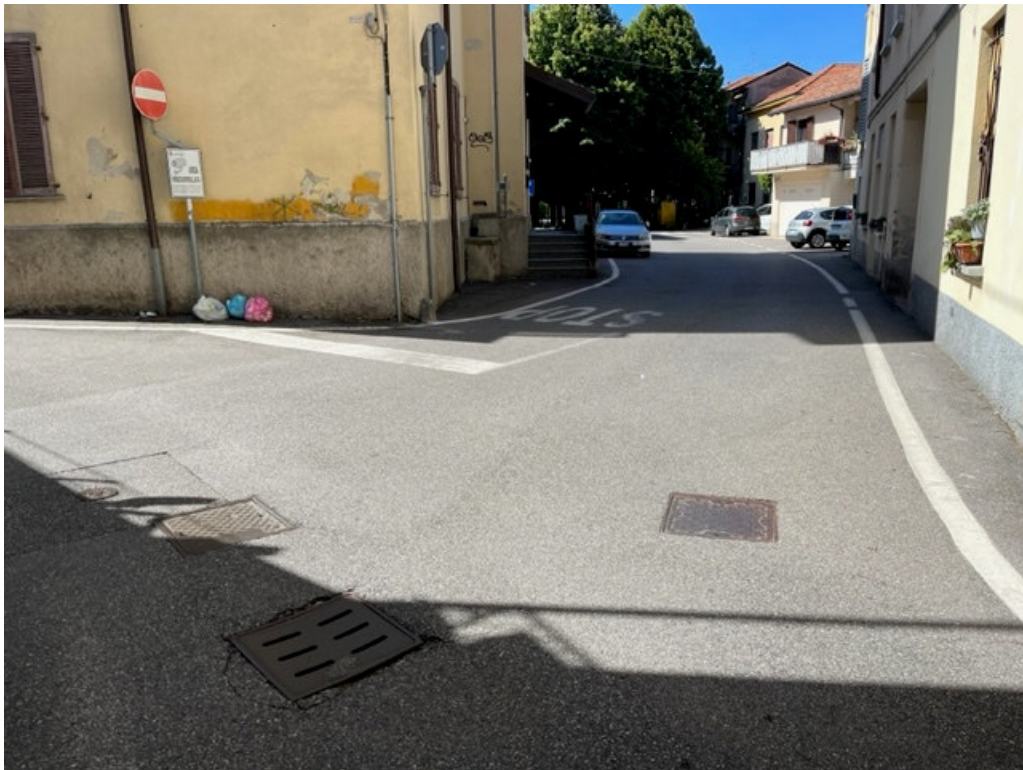
Foto n.13- Incrocio Via Cavour e Piazza Nazario Sauro