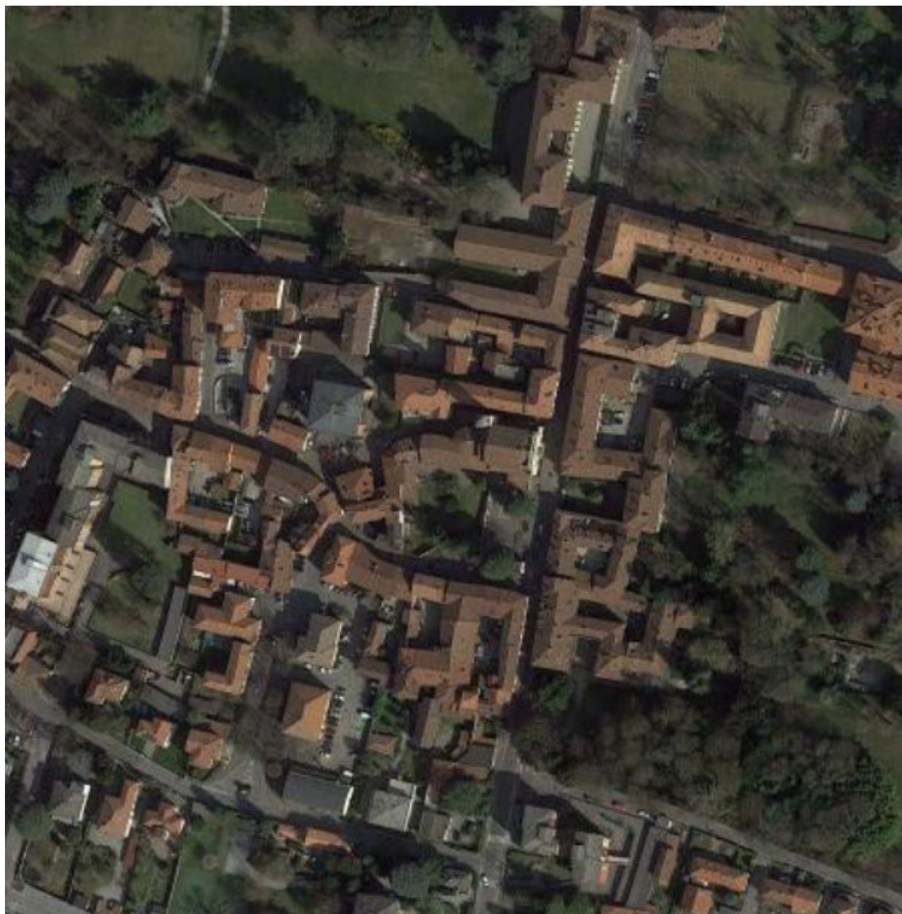
FOTO AEREA DELLA ZONA